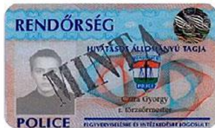
【真正な警察官身分証】