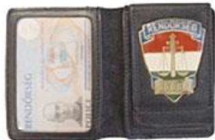
【真正の警察官身分証】