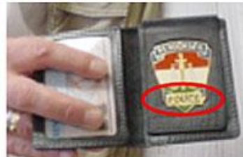
【偽の警察官身分証の例】