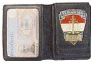
【真正の警察官身分証】