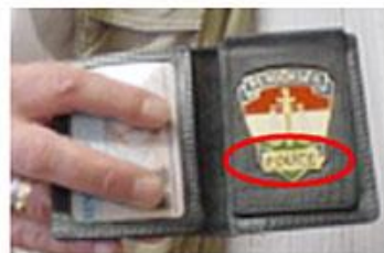
【偽の警察官身分証の例】