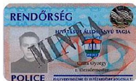
【真正な警察官身分証】